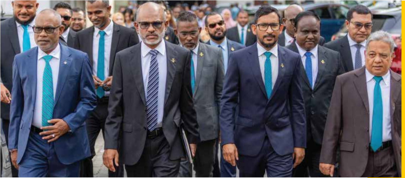
المنتدى العالمي للتعاون الاقتصادي والاجتماعي