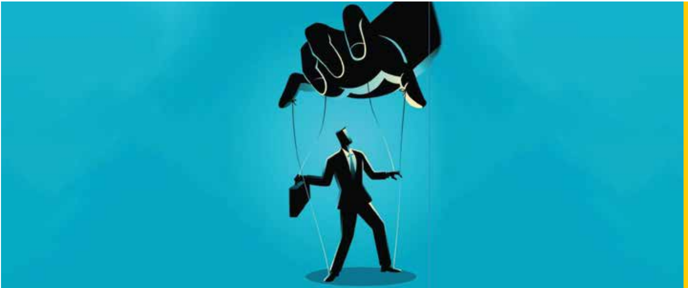
דער נאמען איז אונזער פוס