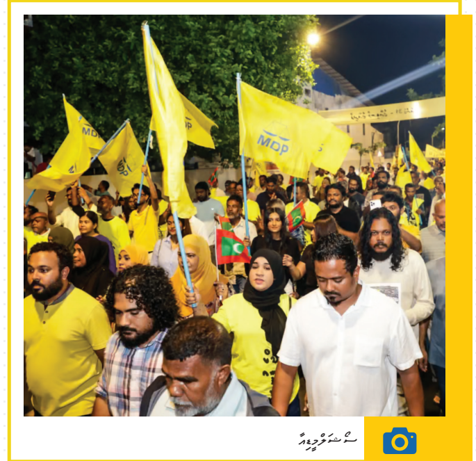
התנועה הירוקה מצטרפת למאבק המוני