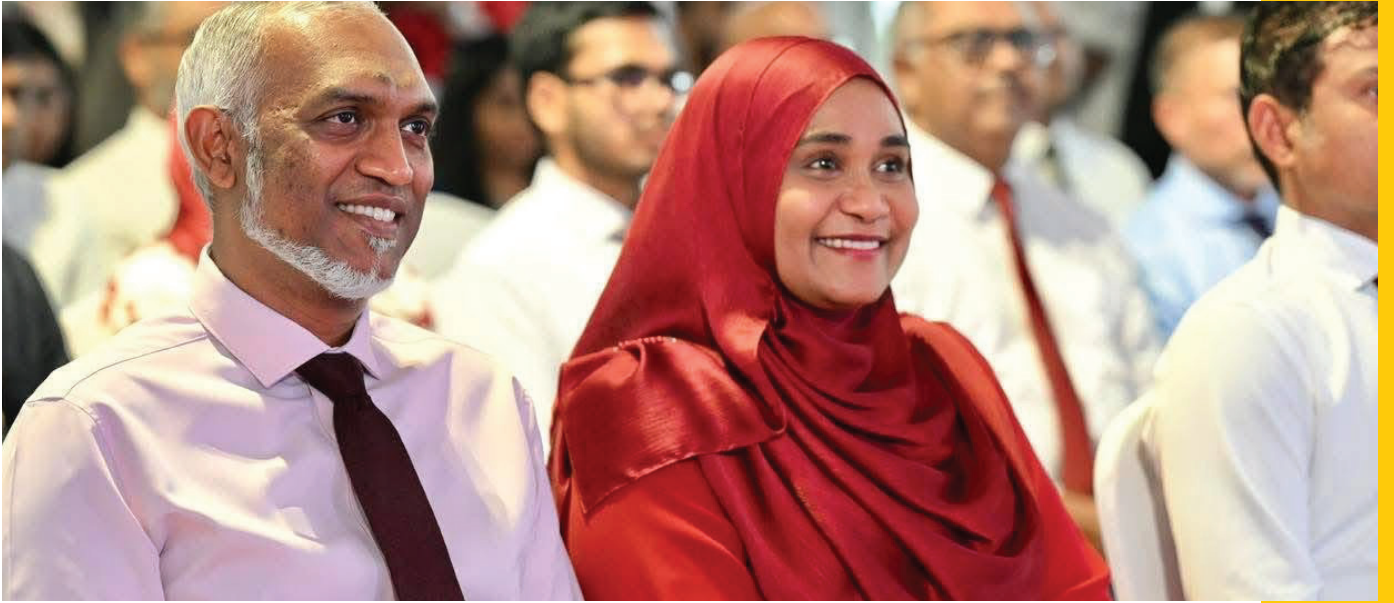
התאחדות עורכי דין