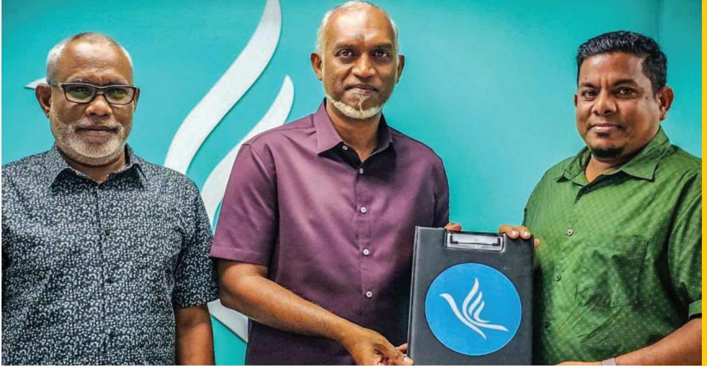
התאגדות מנהלים מקצועיים