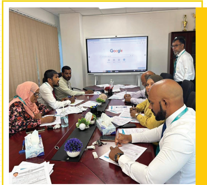
התכנית החדשה לניהול משא ומתן

התכנית החדשה לניהול משא ומתן היא תוצאה של שיתוף פעולה בין מדינת ישראל למועצה הכלכלית העולמית (CEPR) ומועצת המזון העולמית (WFP). התכנית מיושמת באמצעות מרכז המחקר והייעוץ לניהול משא ומתן (CEN) בירושלים. התכנית מיושמת באמצעות מרכז המחקר והייעוץ לניהול משא ומתן (CEN) בירושלים. התכנית מיושמת באמצעות מרכז המחקר והייעוץ לניהול משא ומתן (CEN) בירושלים.