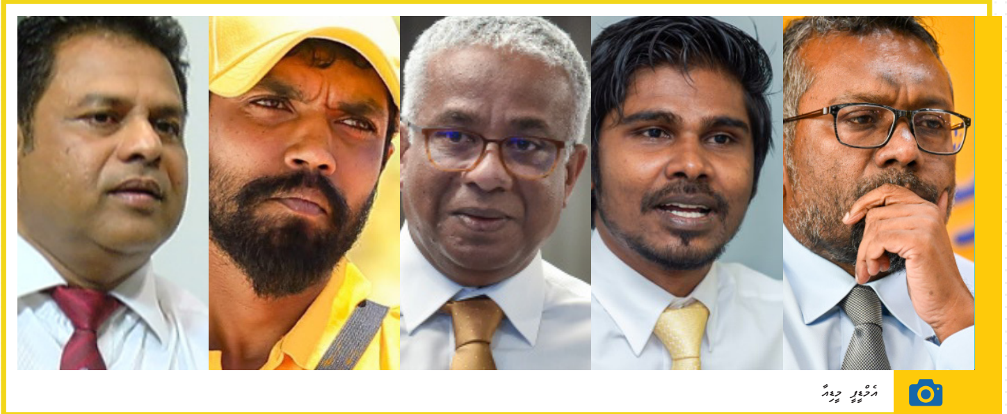
הודיעה: רשות הבריאות

המחלקה לביטחון ובריאות בעבודה הודיעה על פיקודי המחלקה לביטחון ובריאות בעבודה הודיעה על פיקודי המחלקה לביטחון ובריאות בעבודה הודיעה על פיקודי