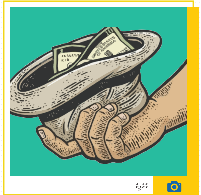
מחלקת המבחנים והמבחנים

המבחנים והמבחנים נערכים על ידי שופט או שופטת, והוא אחראי על כך שהמבחנים והמבחנים יתקיימו בצורה הוגנת. המבחנים והמבחנים נערכים על ידי שופט או שופטת, והוא אחראי על כך שהמבחנים והמבחנים יתקיימו בצורה הוגנת.