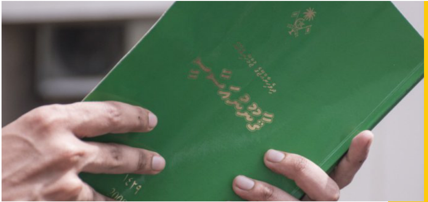
תמונה: מערכת המעקב והדיווח