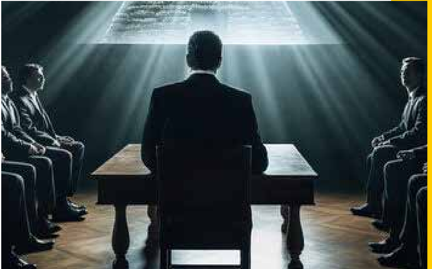
אונזערע זענטערס זענען פארמאגטע פאר אונזערע קליענטן