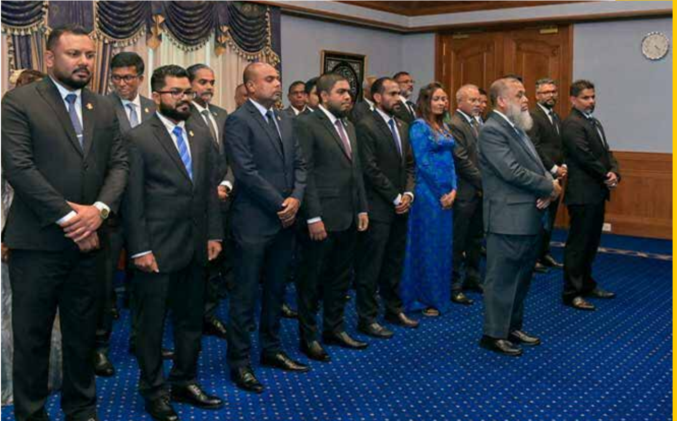
הממשלה בראשות נתניהו