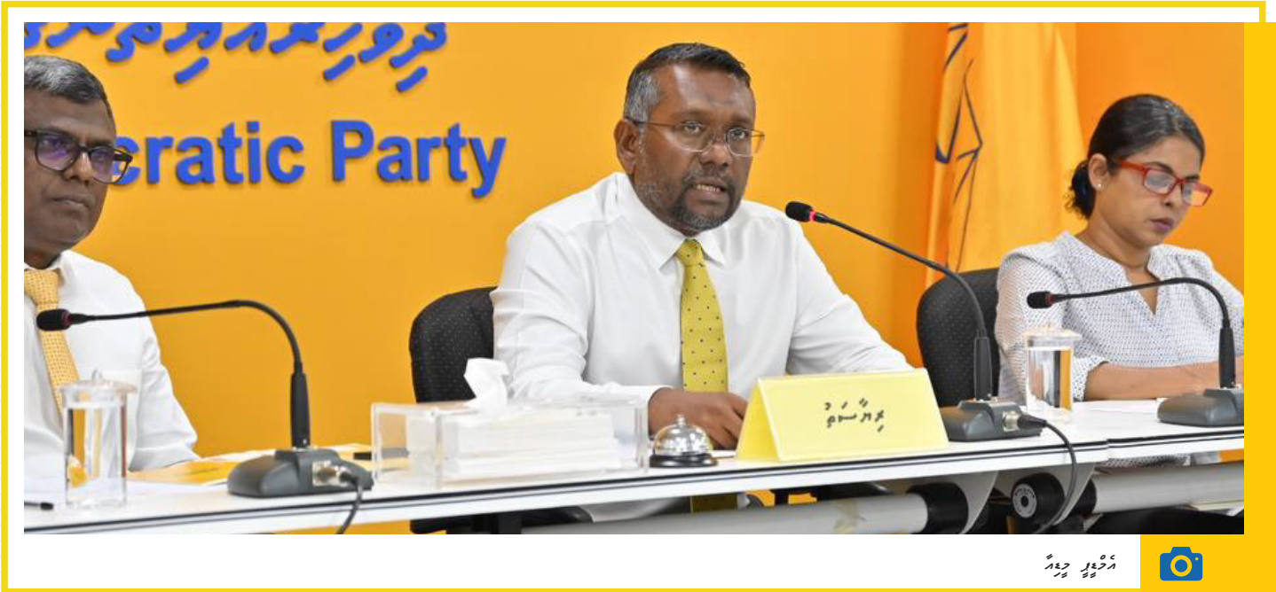
13 : 03 2024