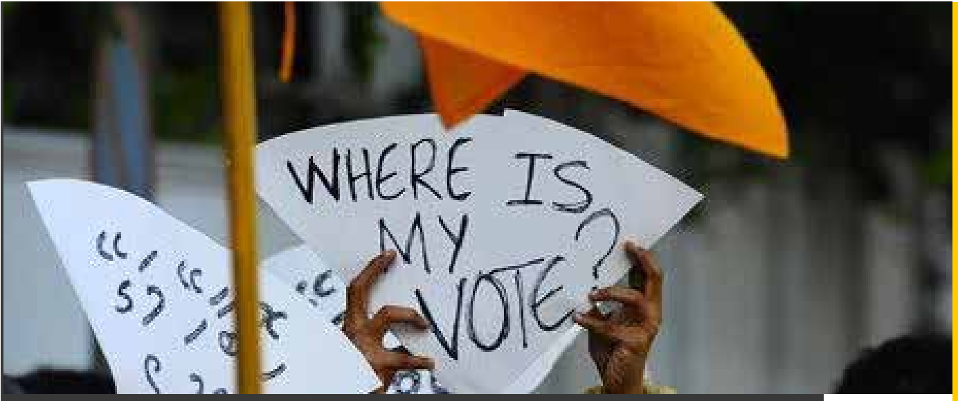
התמונה: דוד גורן