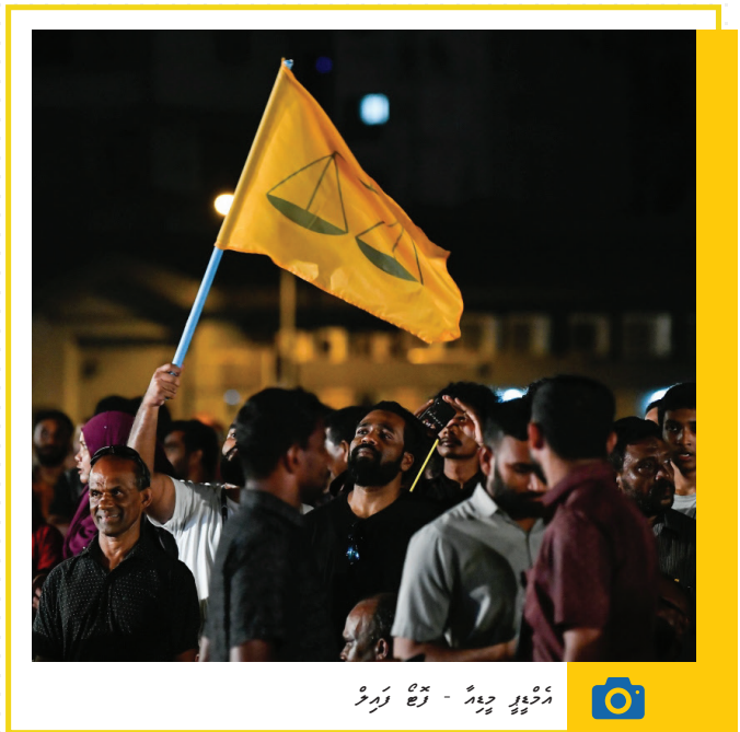
الاحتجاجات - 19 مايو 2024

في 17/05/2024، تظاهر الآلاف من المواطنين في العاصمة الرباط، مطالبين بوقف العنف ضد الصحفيين والاعتصامات السلمية. كما جرت تظاهرات في مدن أخرى مثل الدار البيضاء، تطالب بالحرية الصحفية والديمقراطية. في 18/05/2024، استمرت الاحتجاجات في مختلف المدن المغربية، مع تزايد حدة المطالبات بتغيير الحكومة ووقف التضييق على الحريات العامة. تظاهر آلاف الأشخاص في مدن مثل مراكش، طنجة، وفاس، مطالبين بالعدالة والشفافية. في 19/05/2024، شهدت مدينة الرباط تظاهرة جديدة، شارك فيها آلاف المواطنين، مطالبين بالتحقيق في فضيحة المحاماة ووقف التضييق على الحريات الصحفية. كما جرت تظاهرات في مدن أخرى مثل الدار البيضاء، تطالب بالحرية الصحفية والديمقراطية. في 20/05/2024، استمرت الاحتجاجات في مختلف المدن المغربية، مع تزايد حدة المطالبات بتغيير الحكومة ووقف التضييق على الحريات العامة. تظاهر آلاف الأشخاص في مدن مثل مراكش، طنجة، وفاس، مطالبين بالعدالة والشفافية.