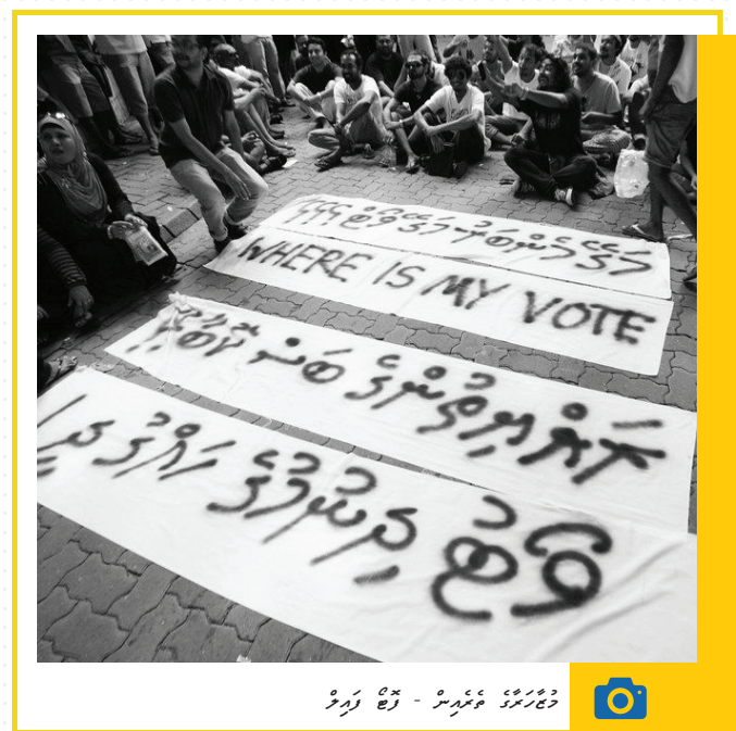
הצבעה - זמן רחוק

המערכת מתמקדת בהגנה על זכויותיהם, בהחלטות על חינוך, בריפוי פסיכולוגי ובטיפול משפחתי. המערכת מתמקדת בהגנה על זכויותיהם, בהחלטות על חינוך, בריפוי פסיכולוגי ובטיפול משפחתי. המערכת מתמקדת בהגנה על זכויותיהם, בהחלטות על חינוך, בריפוי פסיכולוגי ובטיפול משפחתי.